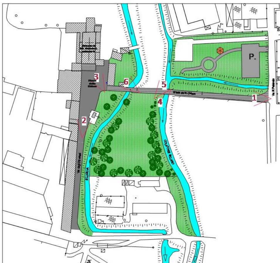
Punti di ripresa fotografica