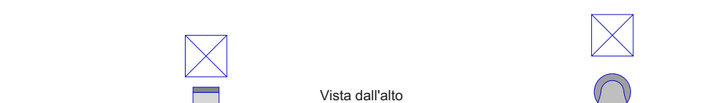
Illuminazione bassa h = mt. 1,10